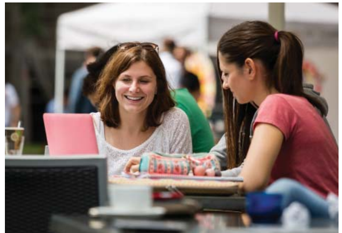
CAMPUS-Office adieu - RWTHonline übernimmt.

Mit dem Start des Veranstaltungs- und Lehrraummanagements und des Studiengangmanagements steigen Studierende zur Planung ihrer Lehrveranstaltungen von CAMPUS-Office auf RWTHonline um. Das heißt, alle Funktionen, die Studierende derzeit zur Planung ihrer Lehrveranstaltungen in CAMPUS nutzen, finden sie ab Juli 2018 in RWTHonline: online.rwth-aachen.de